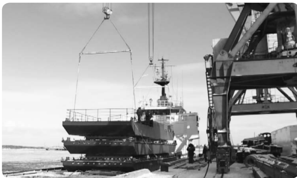
Выгрузка понтонного моста в Нарьян-Марском порту

Понтонный мост Нарьян-Мар – Тельвиска, как детский конструктор – состоит из нескольких деталей, которые собираются в единую конструкцию. Вот только габариты совсем не игрушечные. Весит каждая из шести деталей