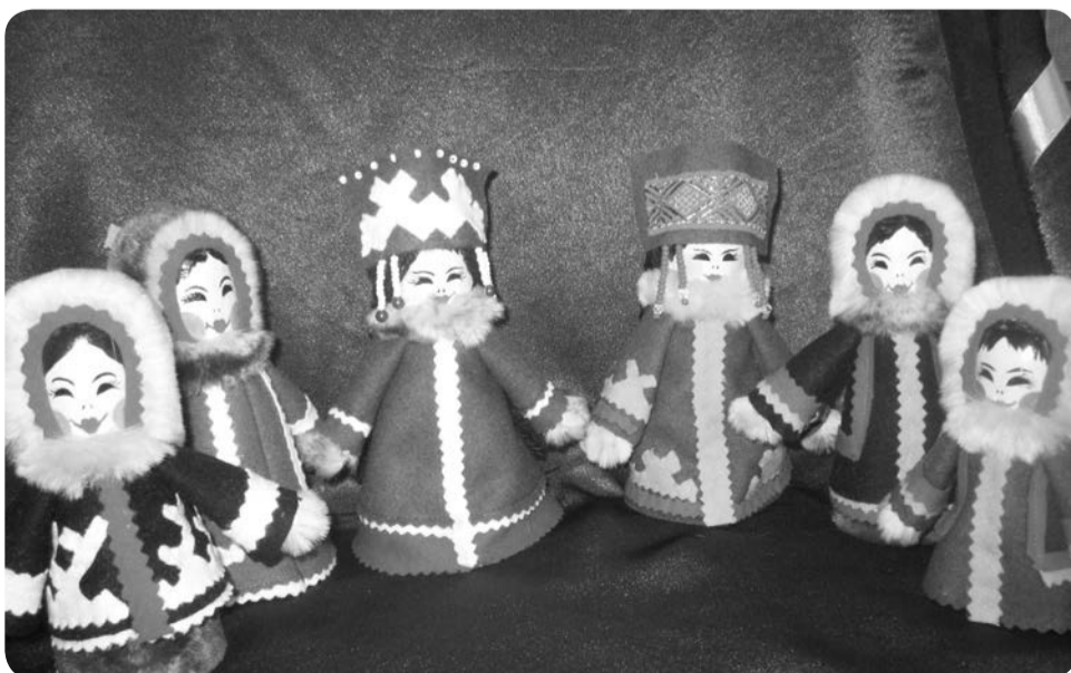
Авторские куклы Натальи ЛАТЫШЕВОЙ, с. Несь

КАЗАЛОСЬ БЫ, ЗАЧЕМ СЕГОДНЯ САМОДЕЛЬНЫЕ КУКЛЫ? ВОН ИХ СКОЛЬКО ПРОДАЮТ – ПЛАСТМАССОВЫЕ, РЕЗИНОВЫЕ, ФАРФОРОВЫЕ! ТОЛПЯТСЯ КРАСАВИЦЫ НА ПРИЛАВКАХ, ГЛАЗЕЮТ НА НАС И ПРОСЯТСЯ В ДОМ.