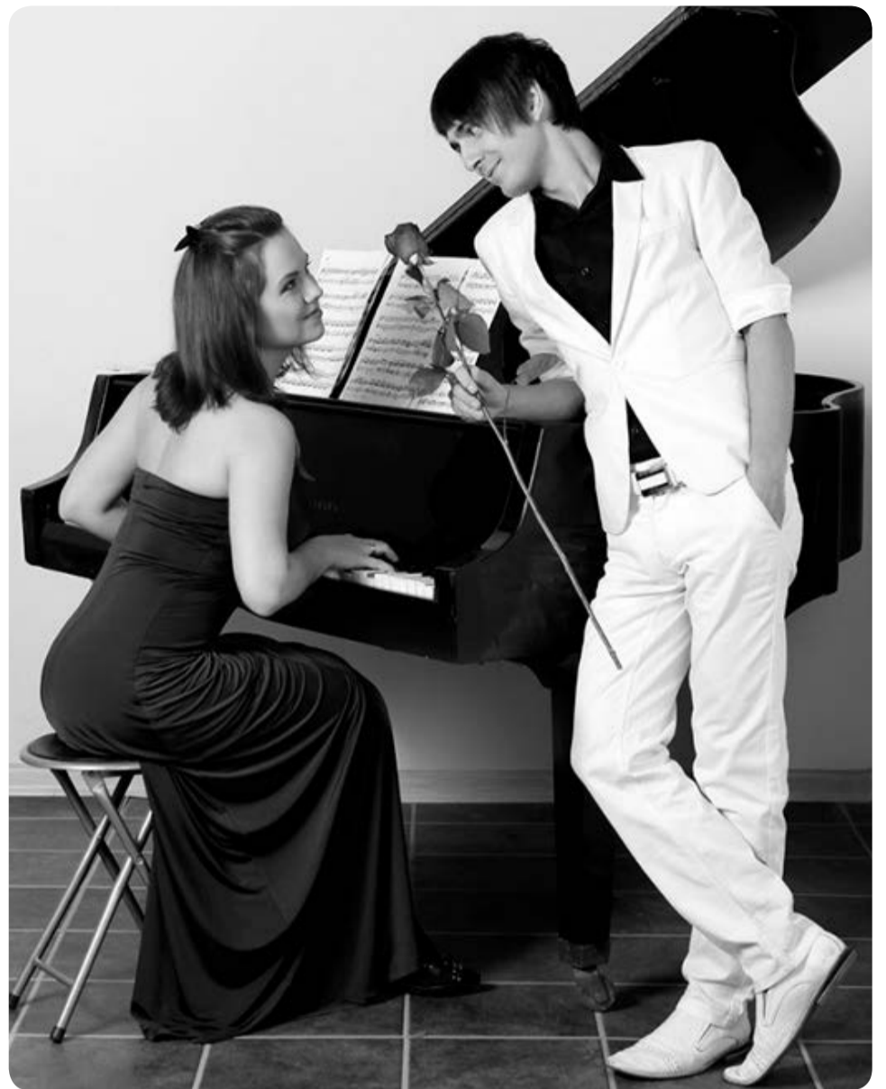
Музыка нас связала...

Павильон оказался обычным одноэтажным зданием. Когда мы туда пришли, в комнате для участников уже находились две пары из четырёх. Мы разговорились, и оказалось, что все немного волнуются. Редакторы успокаивали, рассказывали о том, что и как нужно будет делать, как себя вести, куда смотреть... Затем всех участников отправили к стилистам. Во время работы визажисты и парикмахеры постоянно болтали о том, над кем из звёзд и ведущих телевидения им довелось «поколдовать». А в результате их стараний мы и сами стали похожи на суперзвёзд. Потом прошла