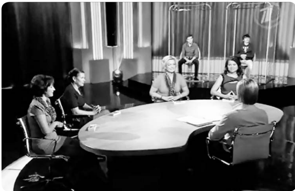
В студии «Первого канала»