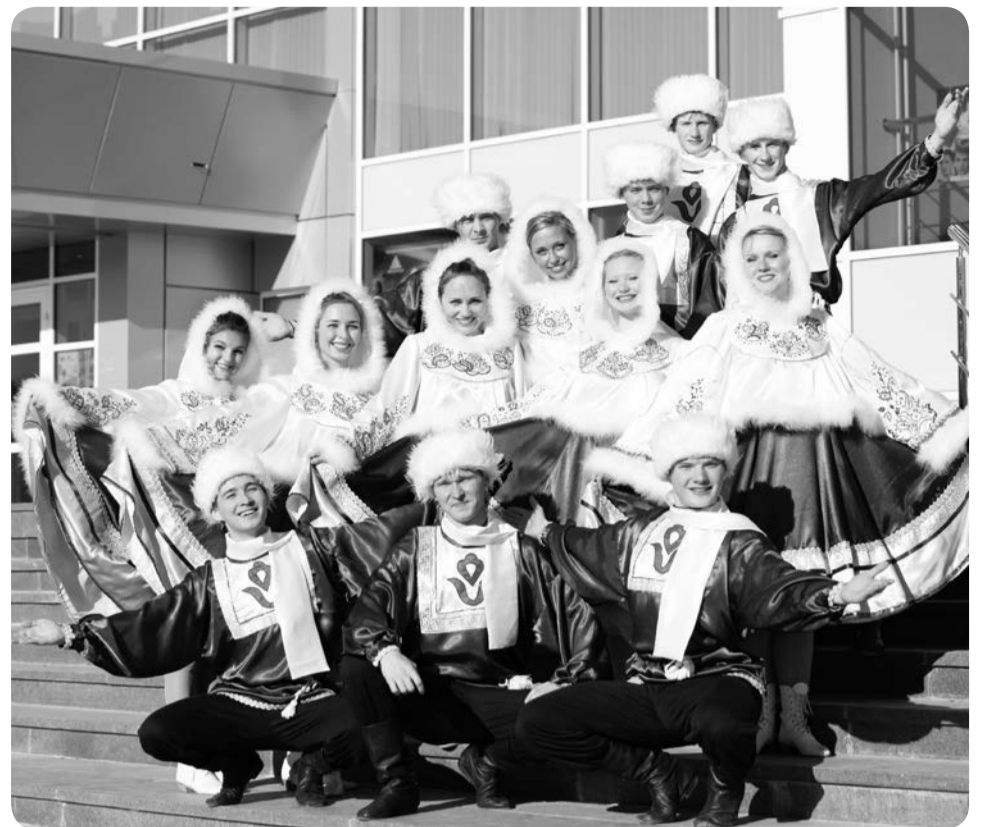
Народный ансамбль танца «Юность Севера»

А в зале Этнокультурного центра свой праздничный вечер провело творческое объединение «Заполярье». Писатели и исполнители округа под аккомпанемент гитары пели песни и читали стихи.