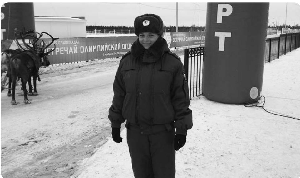
Наша служба интересна и важна