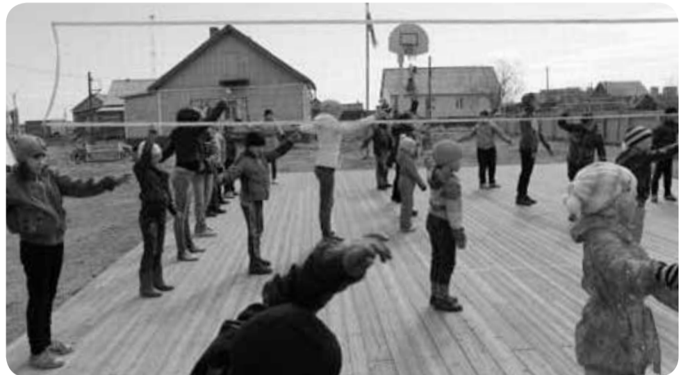
Зарядка на свежем воздухе

В летнем лагере при школе посёлка Усть-Кара с целью расширения кругозора школьников, развития познавательных интересов и творческих способностей всю смену работали постоянные кружки. Ребята клеили, мастерили, учились работать с различными поделочными материалами. Они также активно участвовали в весёлых стартах, викторинах, познавательных играх, в создании совместных проектов.