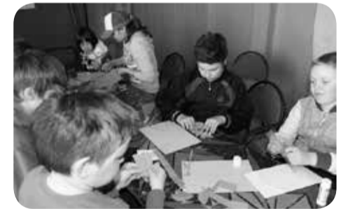
Развитие творческих способностей

Все участники конкурса получили ценные призы, дипломы и благодарственные письма. Средства на их приобретение предусмотрены в рамках муниципальной программы «Развитие образования муниципального района «Заполярный район». Конкурсная комиссия рекомендовала директорам школ поощрить начальников и воспитателей летних лагерей.