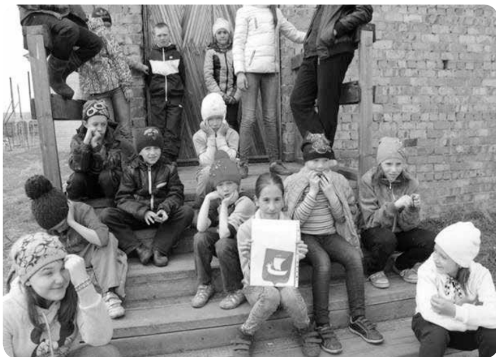
Победителем стала средняя школа Оксина