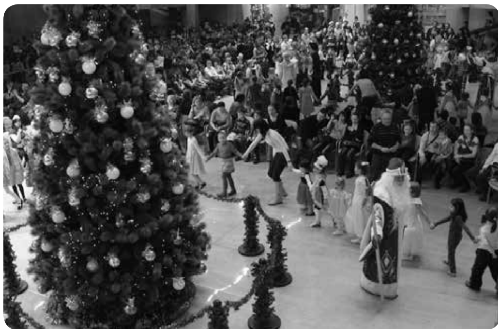
Кремлёвская ёлка для лучших учеников проводится ежегодно