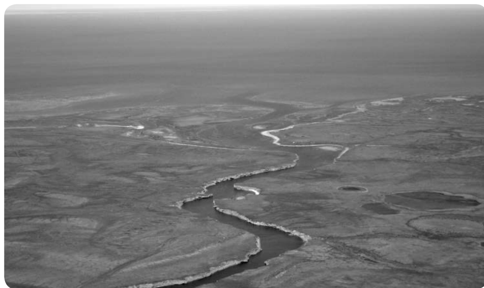
Заполярный район сейчас обозначат на географических картах