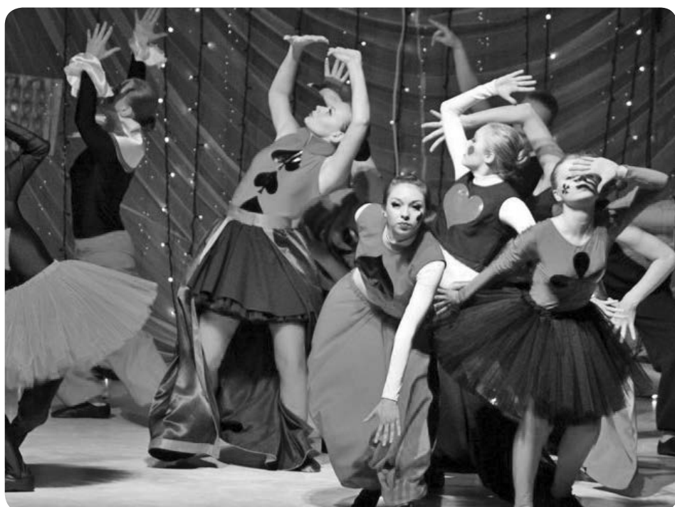
В составе коллектива Teens выступает 11 девушек

Teens это первый отчётный концерт. Так уж вышло, что он же юбилейный, поэтому для нас очень важен и волнителен. Хочу сказать девочкам огромное спасибо за труд, за стремление к лучшему, за эмоции. Сейчас я вижу в их глазах, что танец для каждой участницы уже не просто хобби, а что-то значимое в жизни. И мне как хореографу и руководителю это очень