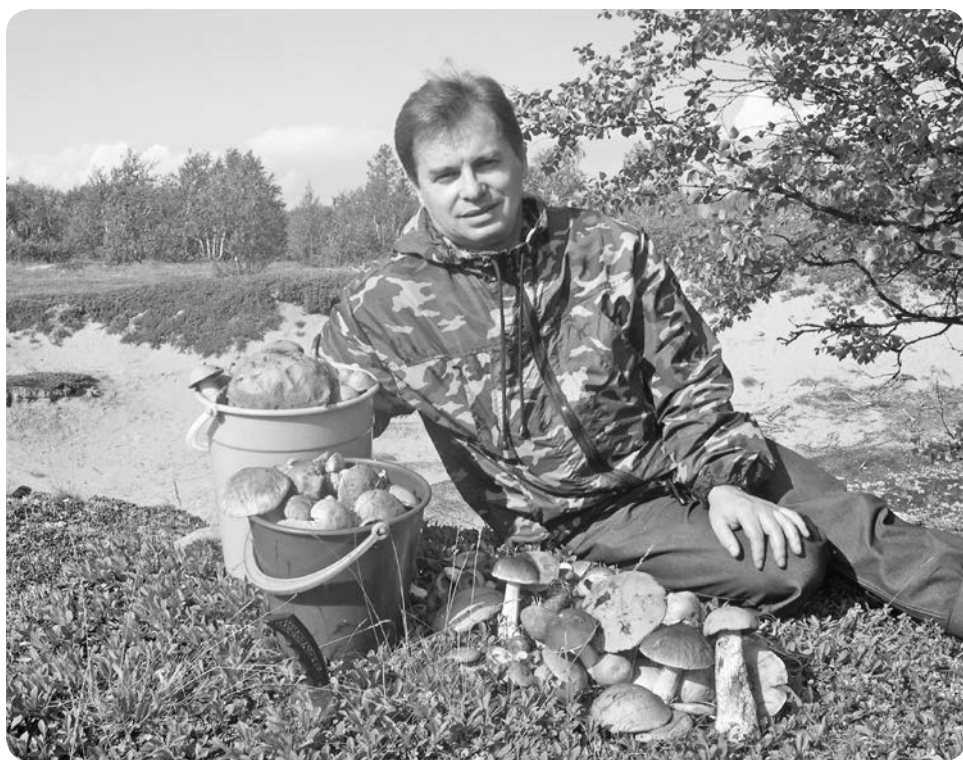
Поездка за город оказалась успешной

Целью своей деятельности в окружном Собрании депутатов, если мне будет оказано такое доверие, считаю совершенствование законодательства в сфере государственного управления и местного самоуправления, общественной безопасности, в интересах дальнейшего социально-экономического развития округа. Надеюсь, что жители избирательного округа, знакомые по работе в городском Совете, мои коллеги по работе в УВД, ветераны вооружённых сил и правоохранительных органов меня поддержат. Со своей стороны готов приложить все усилия для улучшения жизни каждого жителя нашего региона.