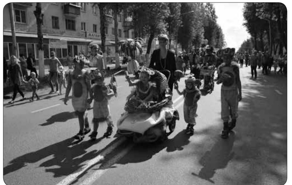
Парад детских колясок в Северодвинске