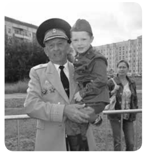
Единство поколений в День ВМФ

В Северодвинске действительно чувствуется забота о каждом его жителе. Так, молодые пары, зарегистрировавшие свой брак в День города, а также те семьи, кто отметил золотой юбилей со дня свадьбы, чувствовали на торжественном вечере, вручив им памятные подарки. Для самых маленьких горожан подарком ко Дню города стало открытие игровой площадки у Дворца молодёжи. Помимо традиционных горок, качелей и каруселей здесь есть и избушка Бабы-яги, планируется в дальнейшем организация других интересных аттракционов. В Северодвинске успешно работают 2 детско-юношеские спортивные школы, 3 стрелковых тира, 259 спортивных сооружений. В городе есть 2 кинотеатра, профессиональный драматический театр, городской краеведческий музей, 5 клубных учреждений, парк культуры и отдыха, выставочный зал. Муниципальная библиотечная система включает 11 библиотек. Профессиональную подготовку специалистов осуществляют 3 филиала высших образовательных организаций, 8 организаций среднего профессионального образования. Муниципальная система образования помимо школ и детских садов включает 11 учреждений дополнительного образования де-