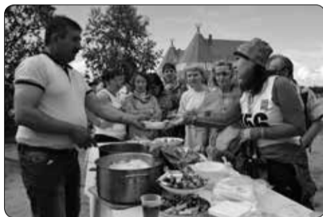
Угощения спортсменам приготовила диаспора Азербайджана

— Мы работаем уже четыре года. За то время подготовлен 321 инструктор