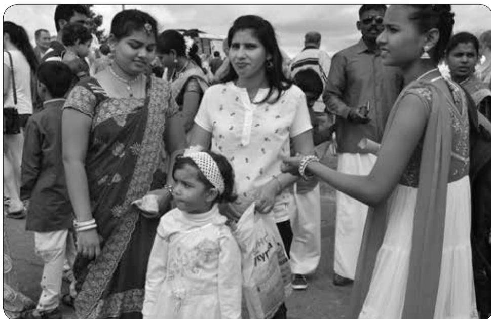
Представители Индии передают свои поздравления