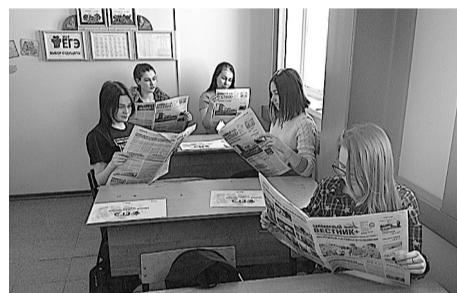
Учащиеся 11-го класса, Нижняя Пеша