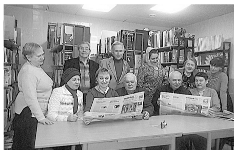
Клуб земляков НАО, Нарьян-Мар