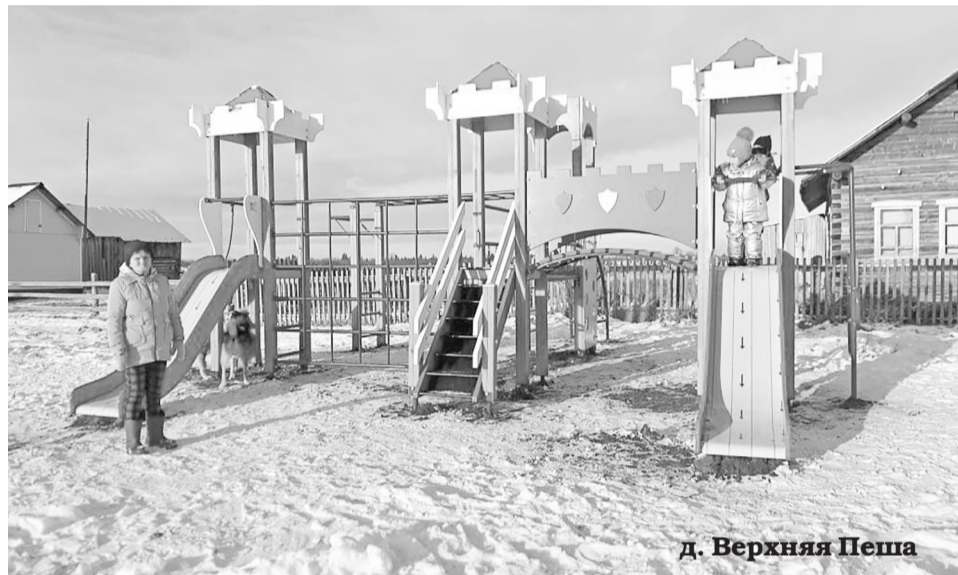
д. Верхняя Пеша

– В этом году мы прибегли к помощи специалиста из Архангельска. Под его руководством бригадой из местных жителей был произведён полный демонтаж штукатурки, кирпичной кладки, плит. Весь процесс, включая сушку конструкций под навесом, грунтовку, укрепление сетками, штукатурку по маякам, покраску, занял полтора месяца. Применённая технология должна предотвратить последующее разру-