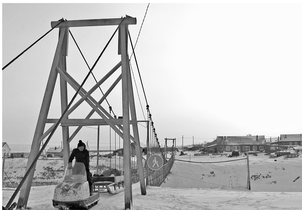
Из районного бюджета будет выделено 4,2 млн рублей на проведение инженерных изысканий и разработку проекта капремонта подвесного моста в Индиге