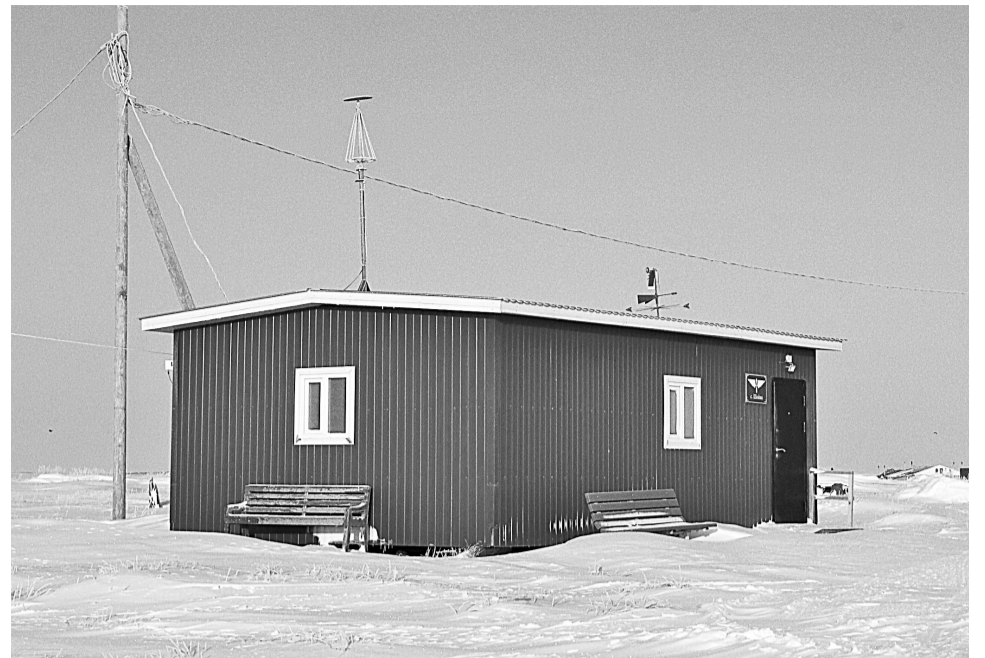
Новое модульное здание ожидания воздушных судов в с. Шойна приобретено в 2017 году

Вокруг детского сада и Дома культуры в Индиге не увидишь привычные кучи угля и дымящие трубы котельных. А всё потому, что СЖКС с 2016 года использует способ отопления социальных учреждений с помощью автома-