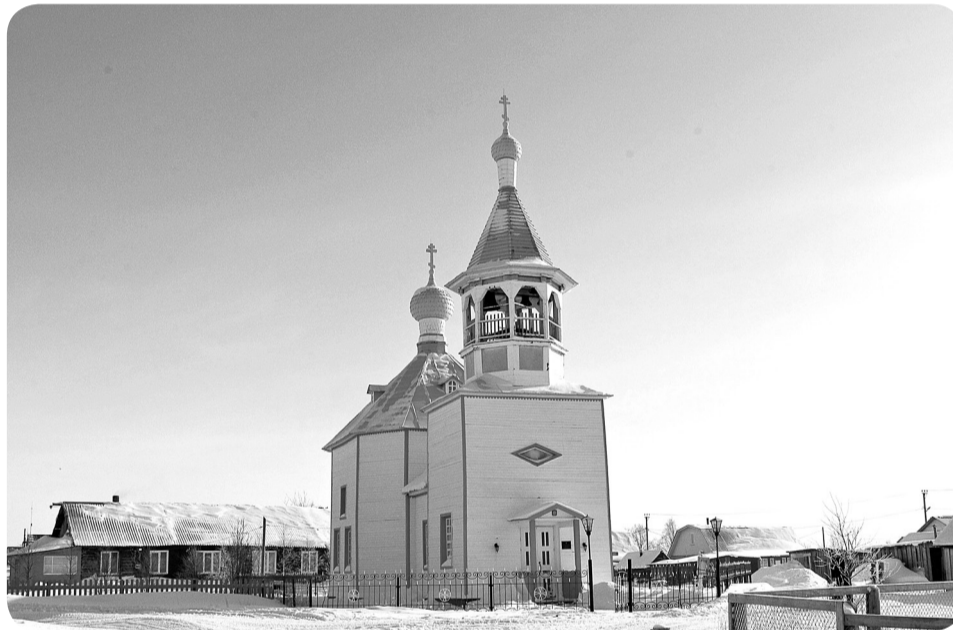
Благовещенская церковь – визитная карточка села Несь

В 2021 году во Мгле появится стела «Вечная память участни-