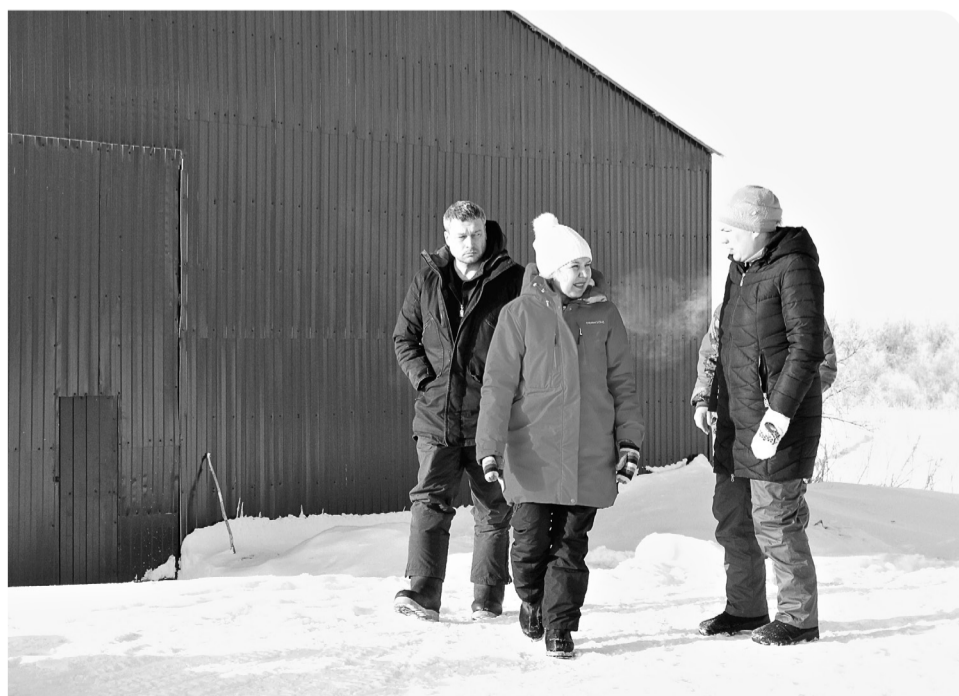
В Неси в дополнение к новому ангару для ТКО планируется установить инсинератор для утилизации отходов

батывается. Средства на проектирование выделены из бюджета Заполярного района.