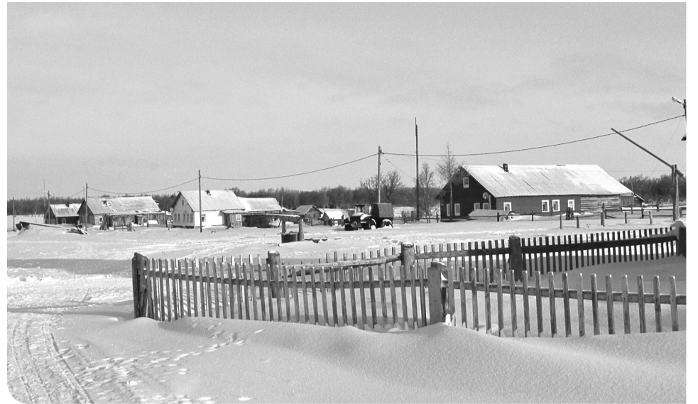
По просьбам жителей деревни Мгла появится новый переход через реку Дикую

Также в этом году в деревне будет оборудована контейнерная площадка для сбора твёрдых коммунальных отходов.