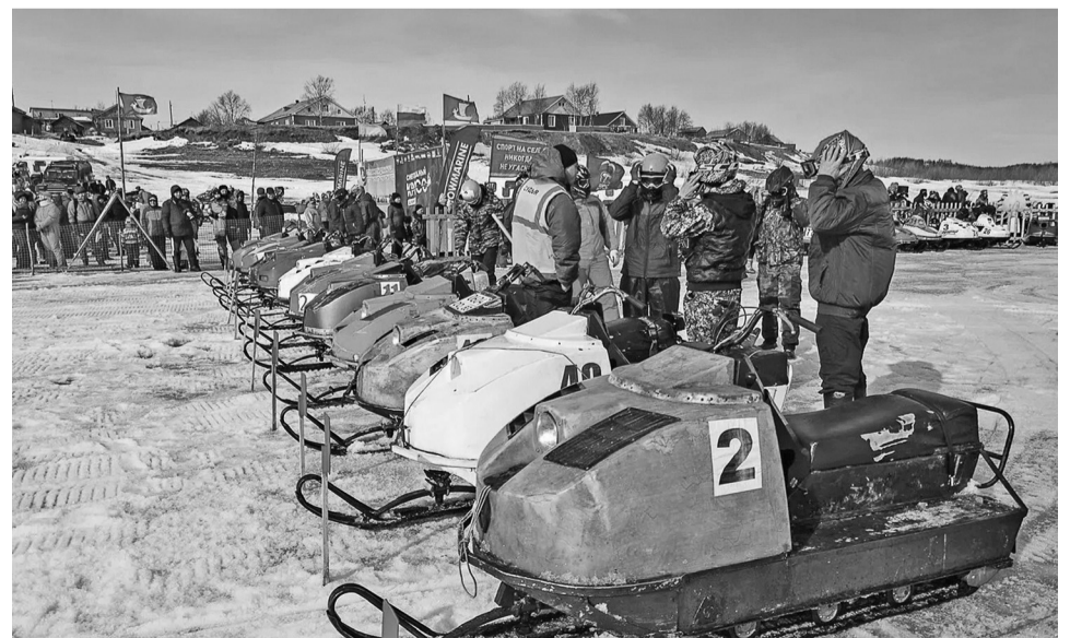
За победу в основном, гостевом, ветеранском и свободном заездах боролись 62 гонщика

Призы и подарки получил каждый участник, вне зависимости от занятого места. Огромный юбилейный торт тоже на всех поровну поделили! Всем хватило, но на следующий год надо побольше заказывать.