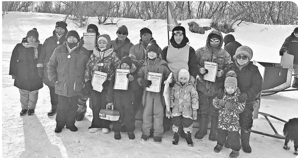
Бывалые и юные рыбаки Нельмина Носа на соревнованиях по спортивной ловле «Золотая рыбка-2021»

В сёлах Заполярного района прошла массовая зимняя рыбалка за два месяца до лета. К межмуниципальным соревнованиям по спортивному рыболовству в Ненецком автономном округе присоединились взрослые и юные рыбаки из Щелино, Великовисочного, Нельмина Носа, Андега, Красного и Куи. Везде рыбачили с соблюдением всех мер безопасности и строгих правил.