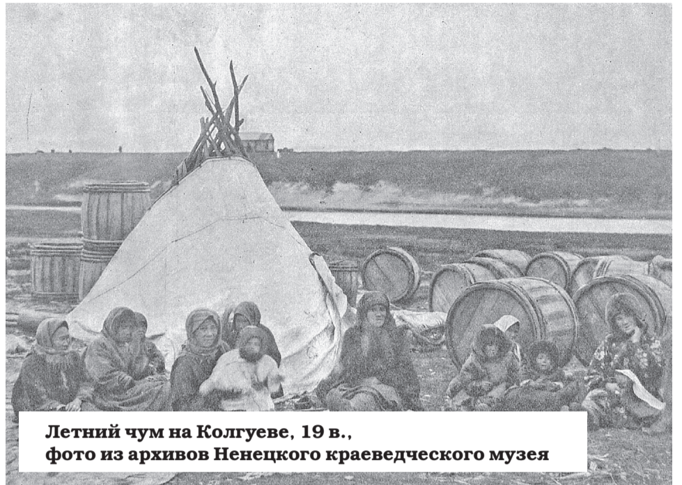
Летний чум на Колгуеве, 19 в.