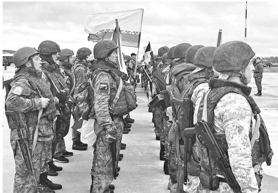
Сборная рота Ненецкого автономного округа, которая отправилась в зону проведения специальной военной операции на территорию Донбасса и Украины

Указ президента о частичной мобилизации вырвал из груди миллионов россиян вздох надежды. «Наконец-то!» – сказали рыбаки и менеджеры, комбайнёры и оленеводы, аспиранты и машиностроители. «Наконец-то!» – окрылились верой в победу старики и школьники, медсёстры и домохозяйки. «Наконец-то!» – воодушевился я и мои друзья, особенно однопольчане, сослуживцы по старым советским временам, когда флаг моей Родины заставлял натовских крыс искать ближайшую щель, куда можно забиться. Наконец-то... Мы долго ждали этого часа. Ожидание – нехорошая вещь. Оно порождает сначала недоумение, потом апатию и скепсис, а дальше, в разной последовательности – расслабленность, неверие, брюзжание, пораженческие настроения. Как у Лермонтова: «Ворчали старики...» И у него же: «Досадно было, боя ждали...»