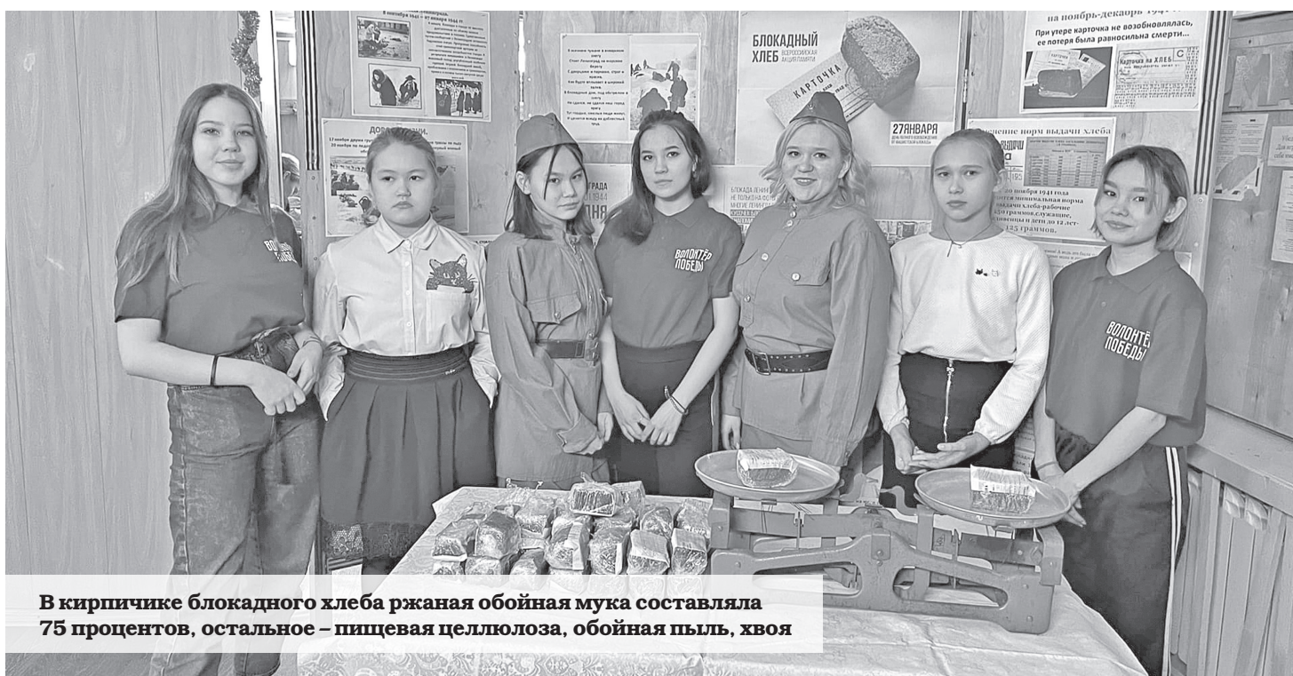
В кирпичике блокадного хлеба ржаная обойная мука составляла 75 процентов, остальное – пищевая целлюлоза, обойная пыль, хвоя