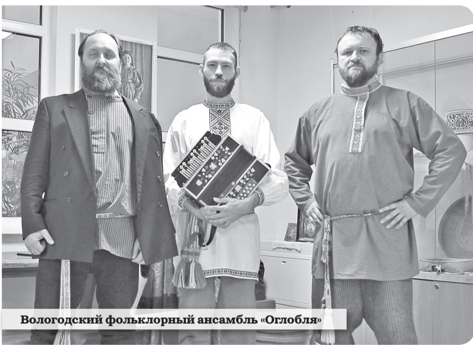
Вологодский фольклорный ансамбль «Оглобля»

– Мы горды, что в этом году фестиваль собрал представителей мужской традиционной культуры, – звучали слова ведущего концерта. – Потому что для мужчин важно не только «посадить дерево, построить дом и вырастить сына», но еще и сохранить национальные культурные традиции, которые являются духовным фундаментом любого народа!