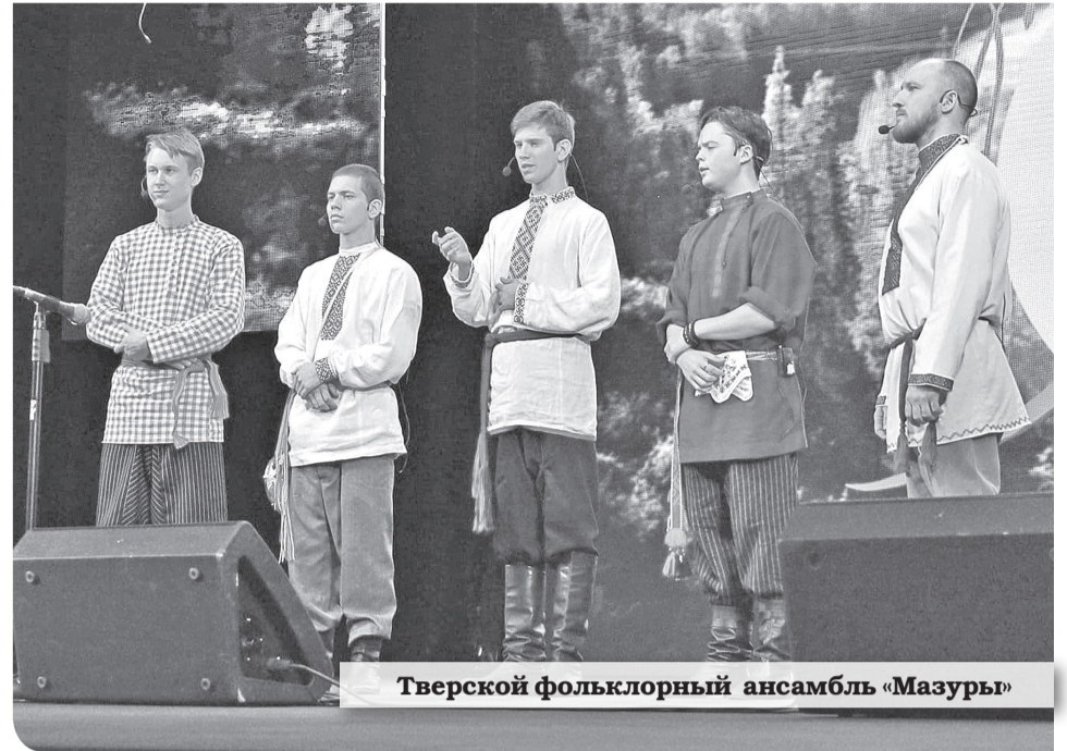
Тверской фольклорный ансамбль «Мазуры»

Мастер увлечён своим делом, на вопрос есть ли у него ученики, с сожалением заметил, что раньше вёл занятия для детей в окружном Доме детского творчества. Но после закрытия косторезных мастерских передавать национальное ремесло в НАО стало некому.