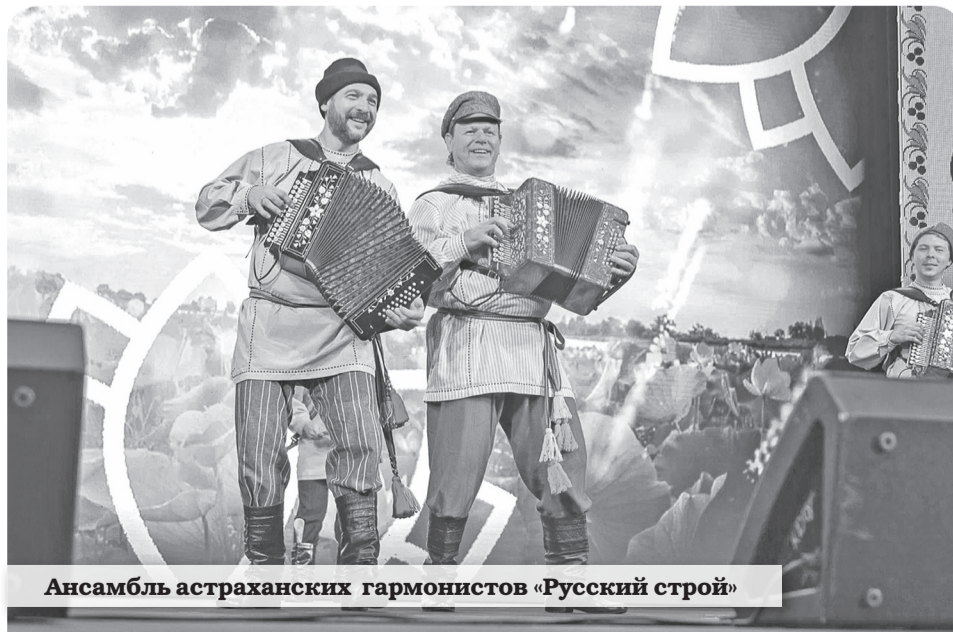
Ансамбль астраханских гармонистов «Русский строй»

– Косторезным искусством занимаюсь давно. Нравится работать с рогом, у него своя пластика, своя красота, которую можно показать минимальными средствами.