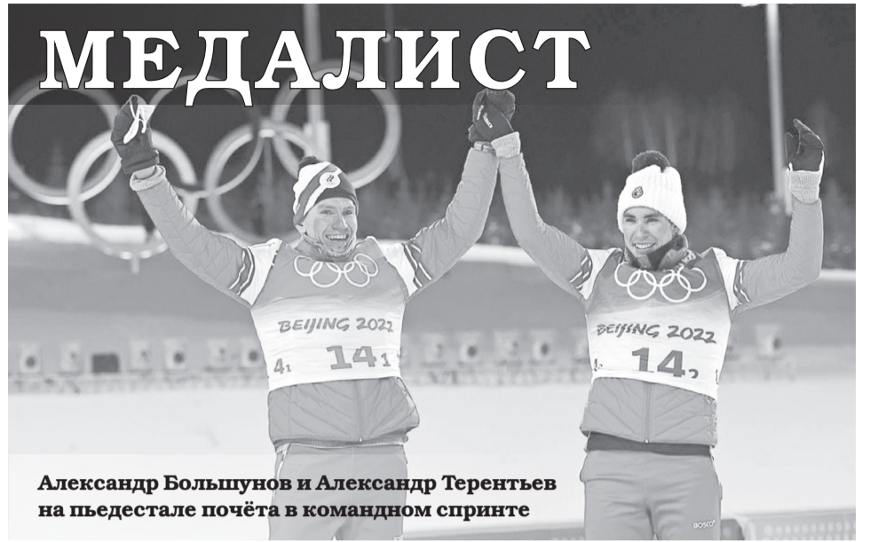
Александр Большунов и Александр Терентьев на пьедестале почёта в командном спринте

но и бронзе очень рады. Чего не хватило мне на финише? Сыграло злую роль, что мы бежали во втором полуфинале и у нас было мало времени на восстановление. На финишной прямой меня уже не хватило, – прокомментировал Александр Терентьев.