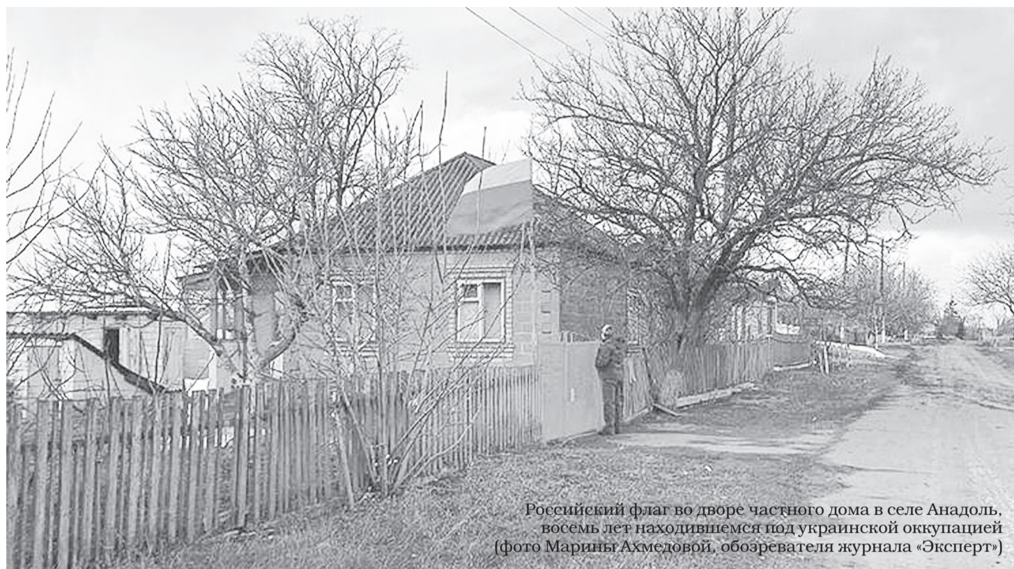
Российский флаг во дворе частного дома в селе Анадоль, восемь лет находившемся под украинской оккупацией