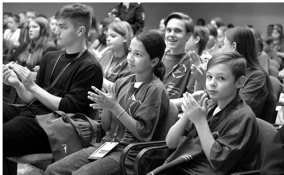
Светлана Балашова, фото автора