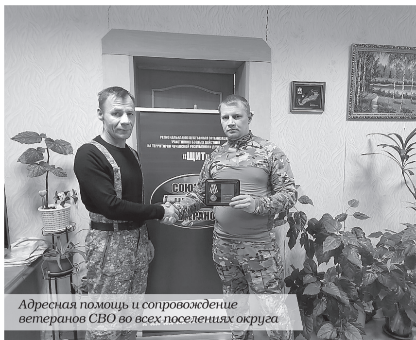
Адресная помощь и сопровождение ветеранов СВО во всех поселениях округа

ников СВО, быть в курсе новостей, иметь возможность помогать. А потом уже попала в фонд.