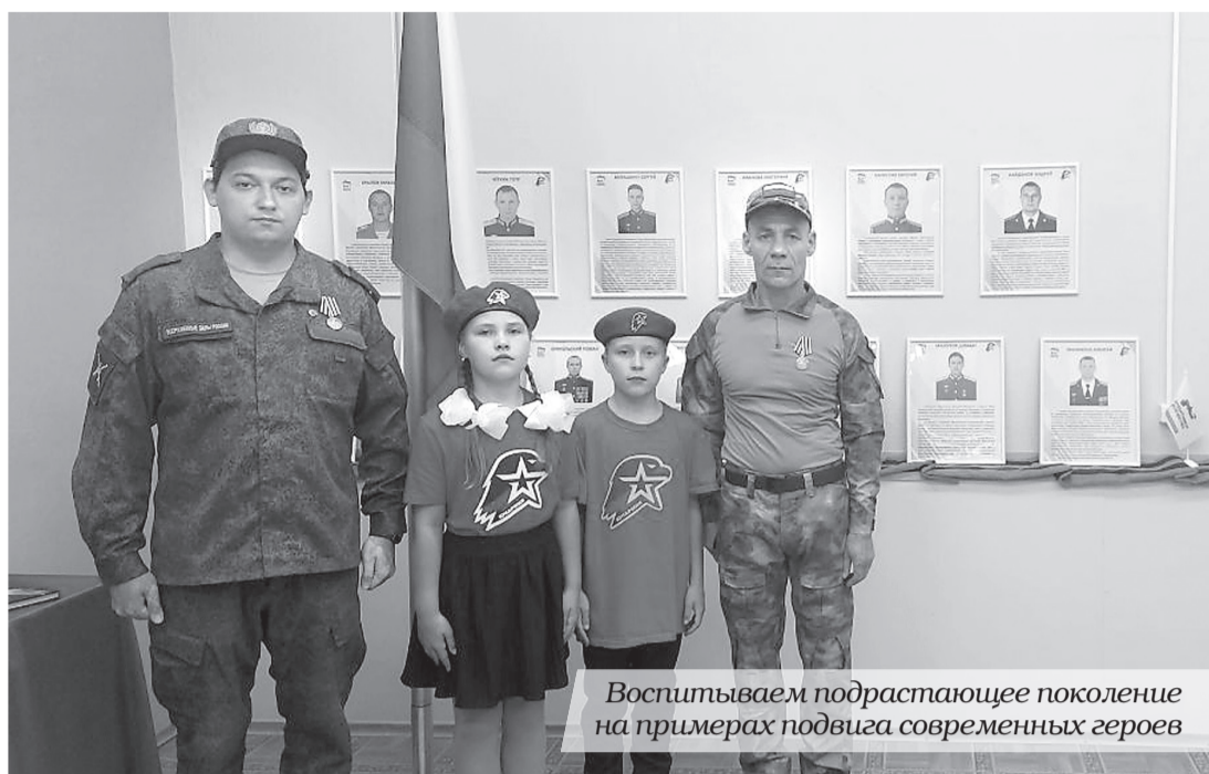
Воспитываем подрастающее поколение на примерах подвига современных героев