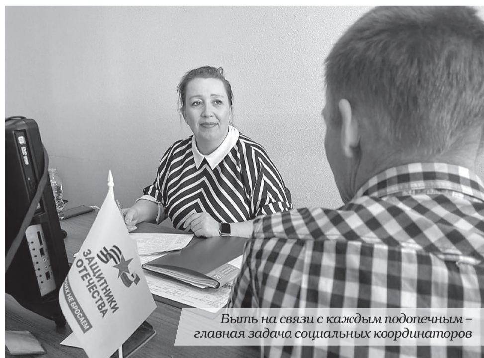
Быть на связи с каждым подопечным – главная задача социальных координаторов

– Я знаю ситуацию изнутри – это очень помогает в работе. Когда муж ушёл на СВО, я активно взаимодействовала с сообществами, которые занимаются гуманитарной помощью, общалась с жёнами, матерями бойцов. Когда ты постоянно в этом варишься, то просто не можешь оставаться равнодушным, – отметила социальный координатор. – Ты пропускаешь через себя каждую проблему, смотришь на неё под углом переживаний человека, его эмоций, страхов и чувств. Поэтому для всех нас в фонде чужих проблем не бывает!