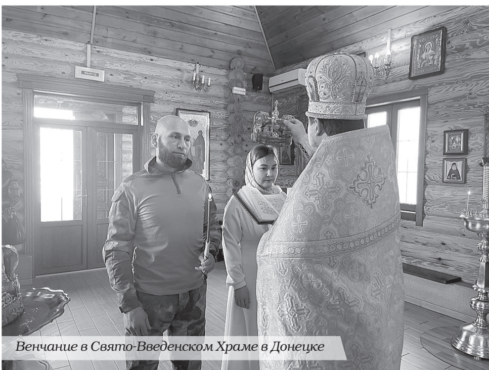
Венчание в Свято-Введенском Храме в Донецке