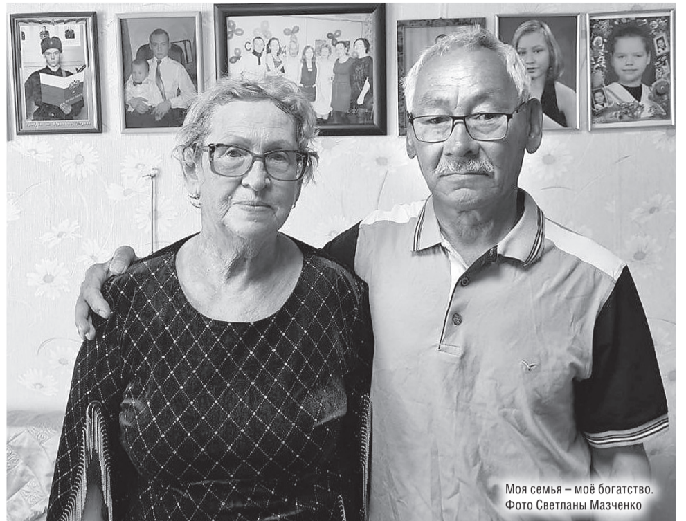
Моя семья – моё богатство.

После школы девушка долго определиться не могла, чему жизнь