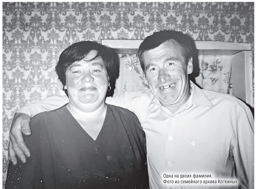
Одна на двоих фамилия.

На селе друг друга все знают, а лучшее место для закрепления