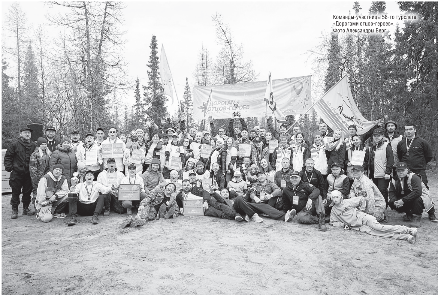
Команды-участницы 58-го турслёта «Дорогами отцов-героев»