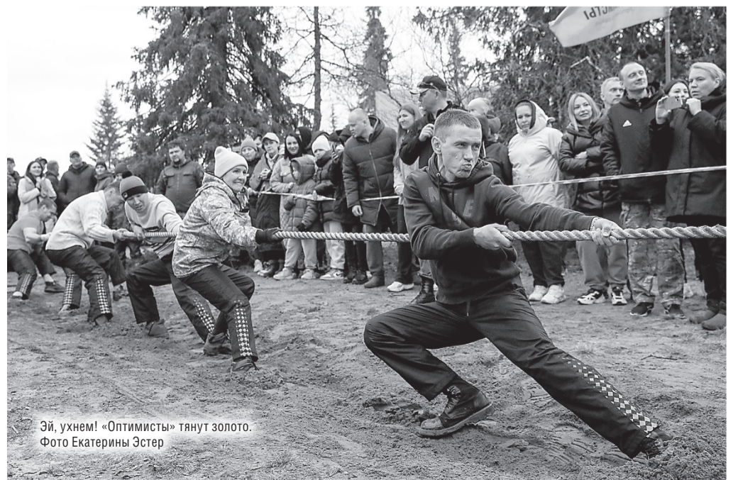
Эй, ухнем! «Оптимисты» тянут золото.