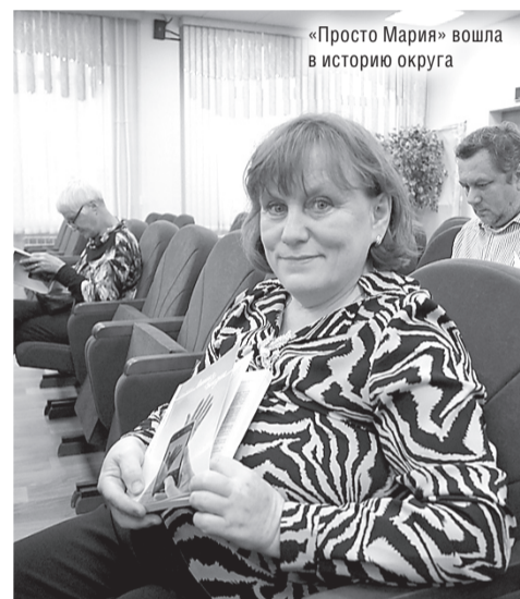
«Просто Мария» вошла в историю округа

– Рассказывать о людях – это благое дело. Книга издана, скоро попадёт в руки к читателю, начинается