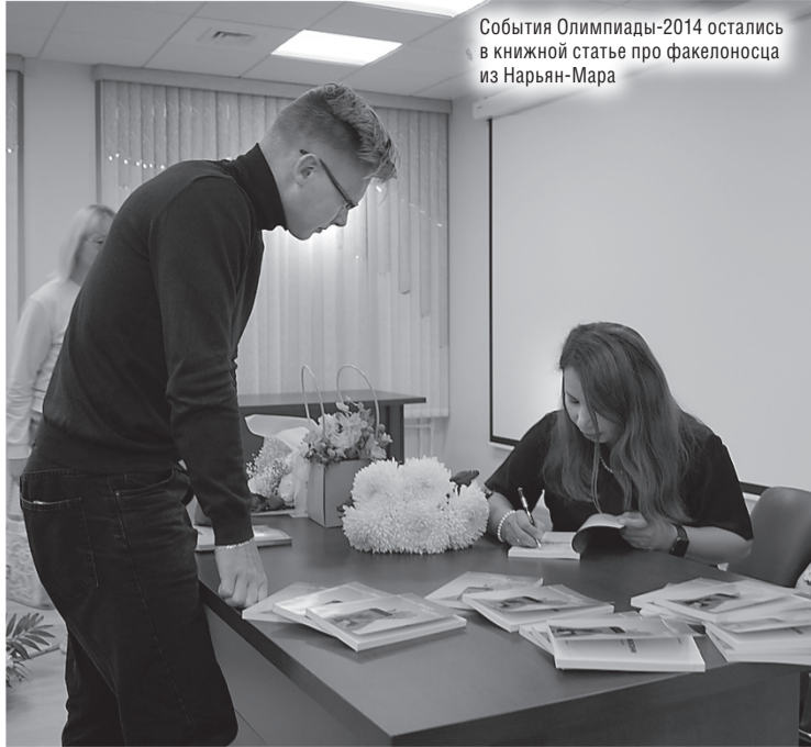
События Олимпиады-2014 остались в книжной статье про факелоносца из Нарьян-Мара