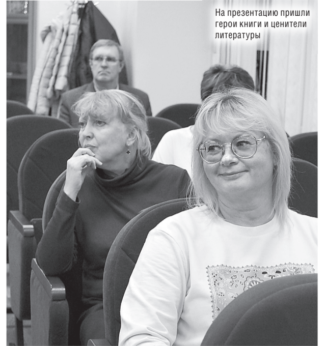
На презентацию пришли герои книги и ценители литературы