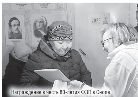
Награждение в честь 80-летия ФЭП в Снопе

Каждый населённый пункт, расположенный на пути, не остаётся без внимания. В Снопе в этом году традиционная встреча состоялась в здании библиотеки. Раньше немногочисленные жители деревни собирались в Доме культуры, но сегодня учреждение не работает. Небольшое помещение, отапливаемое печкой, освещаемое весенним солнцем, было наполнено улыбками. Ведь гости из города привезли с собой награды и поздравления для работников и ве-