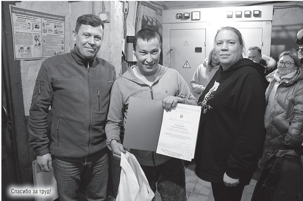
Спасибо за труд!