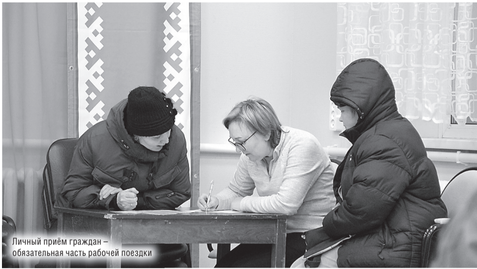
Личный приём граждан – обязательная часть рабочей поездки