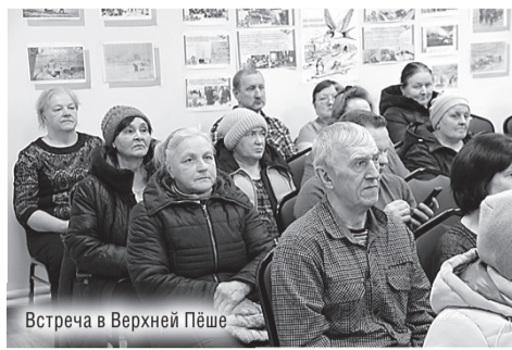
Встреча в Верхней Пёше

Для маленьких населённых пунктов поселения характерна общая