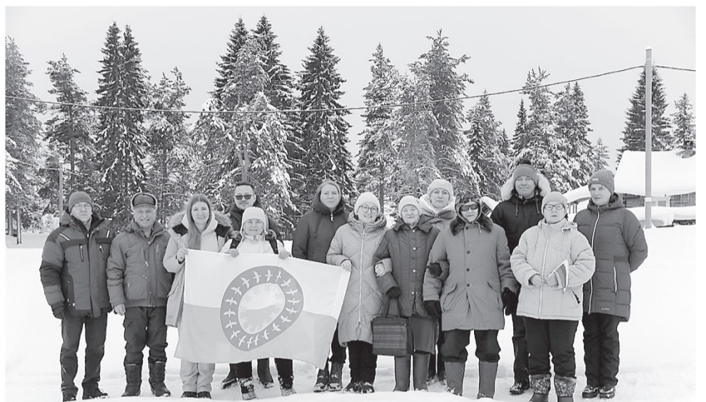
Спасибо, Волоковая, за гостеприимство!

реть вариант переезда в здание гостиницы, принадлежащей пёшскому МКП. Но, по словам заведующей библиотекой, есть опасения, что это будет смена шила на мыло. Поэтому в идеале стоило бы построить специальное помещение.