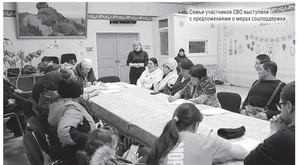
Семьи участников СВО выступили с предложениями о мерах соцподдержки