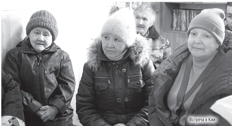
Встреча в Кии

Подсчитать количество пирогов, шанежек, а также вкусных блюд из рыбы, которыми тепло встречали делегацию жители деревень и сёл, не представляется возможным. От лица каждого участника поездки искренне благодарим за щедрость и гостеприимство. У северян самые горячие сердца. Этому получено очередное доказательство.