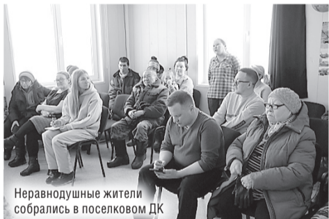
Неравнодушные жители собрались в поселковом ДК

Старт рабочей поездке был дан в Тиманском сельсовете. Первая встреча состоялась в ДК посёлка Выучейского. Диалог сразу получился оживлённым, было заметно, что у людей накопились вопросы. Среди них, например, просьба об установке на ДЭС более мощных генераторов. Аргументируют местные жители такое желание тем, что с каждым годом в домах появляется всё больше техники, соответственно, требуются большие объёмы электричества. Есть у сельчан претензии и к недавнему ремонту в общественной бане, и к качеству мобильной связи и Интернета. Последняя тема, стоит отметить, поднималась практически в каждом населённом пункте.