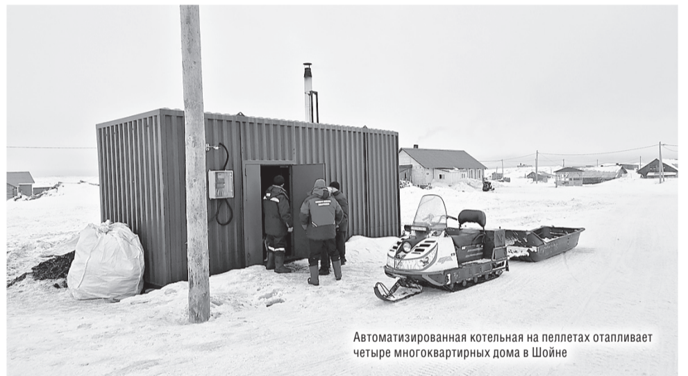
Автоматизированная котельная на пеллетах отапливает четыре многоквартирных дома в Шойне

По возвращении в Шойну рабочая группа отправилась по социальным и энергетическим объектам села. Посмотрели в деле новый транспортный теплогенератор, работающий на пеллетах. С его помощью отапливается четыре 4-квартирных дома. Зашли также в местную