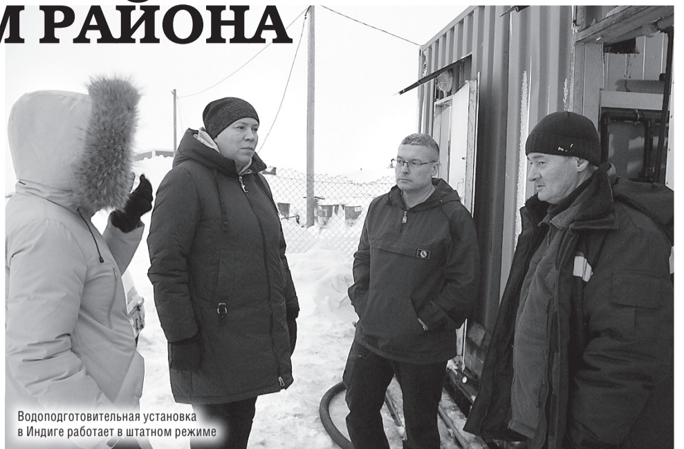
Водоподготовительная установка в Индиге работает в штатном режиме