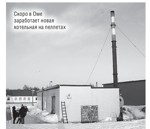
Скоро в Оме заработает новая котельная на пеллетах

В ходе общения жители поделились своими чаяниями, рассказали, что косить траву летом в деревне нечем. Точнее, косилка имеется, но бензин для неё не привозят от сельсовета. Есть проблемы с размещением передвижной медицинской бригады. Учитывая, что в деревне живёт много пенсионеров, приезд врачей – дело важное и необходимое. Но в связи с закрытием Дома культуры было потеряно единственное место возможного размещения специалистов. Все вопросы были взяты в работу.