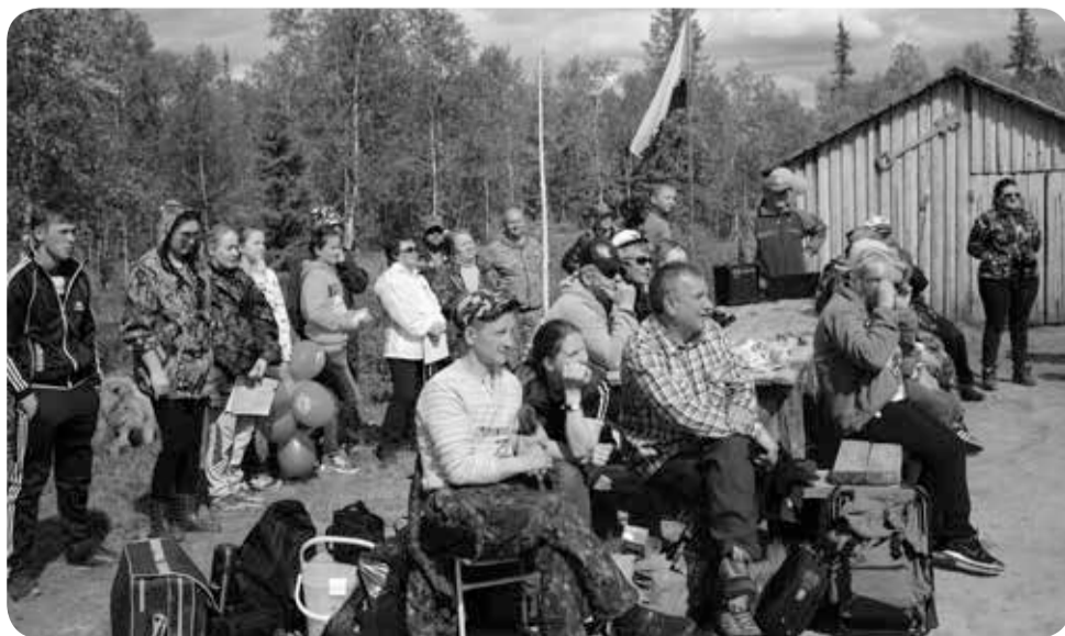
Гости праздника сами когда-то были «ледковцами»