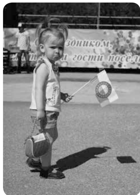
Юноя жительница Заполярного района