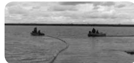
Работы продолжались до позднего вечера

локализованы и устранены. Между тем, ОАО «Севергеофизика» (Респ. Коми) предстоит осуществить подъём судна со дна реки и транспортировку барж с места ЧС, а также провести рекультивацию земли.