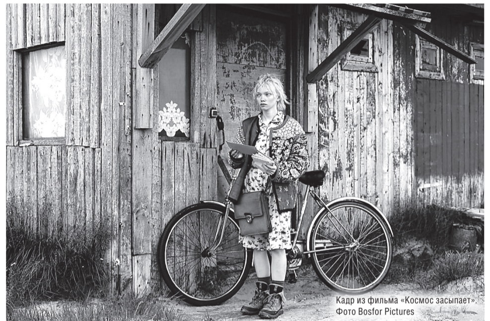
Кадр из фильма «Космос засыпает».