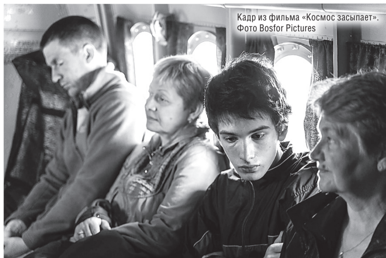
Кадр из фильма «Космос засыпает».