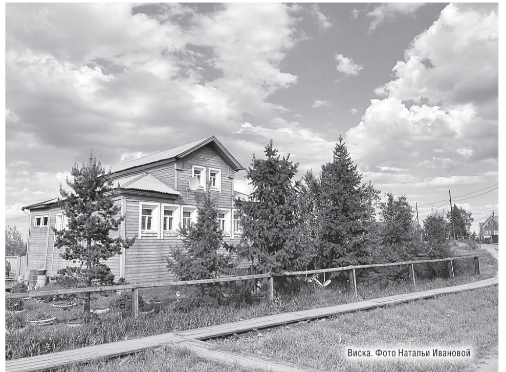
Виска. Фото Натальи Ивановой

– Сашк, а Сашк, соври что-нибудь, а? Повесели.