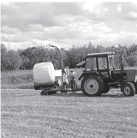
Полоса подготовлена по материалам пресс-службы администрации Заполярного района

Уточнение. В опубликованной 16 августа 2024 года статье «Ремонт – дело затратное» в №16(312) допущена ошибка. Предложение «808 миллионов 200 тысяч рублей выделено на текущий ремонт квартир № 2 и 3 в жилом доме № 7 по улице Новосёлов в селе Несь» следует читать «808 тысяч рублей выделено на текущий ремонт квартир № 2 и 3 в жилом доме № 7 по улице Новосёлов в селе Несь».