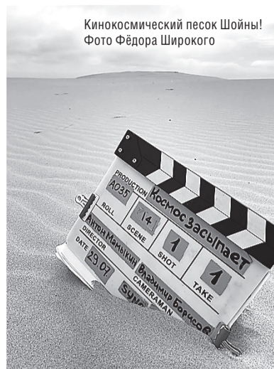
Кинокосмический песок Шойны!