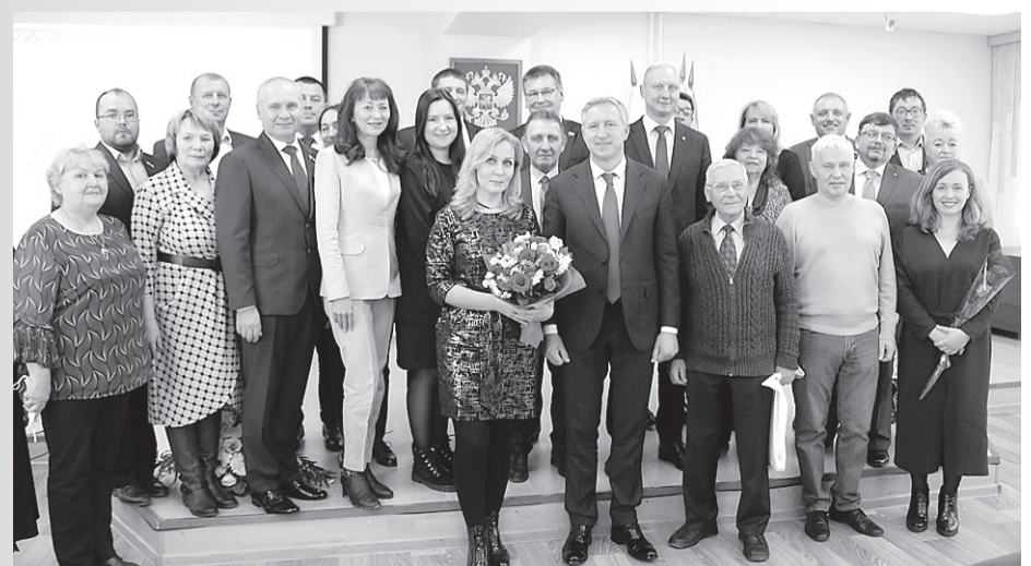
Фото с официальной презентации книги