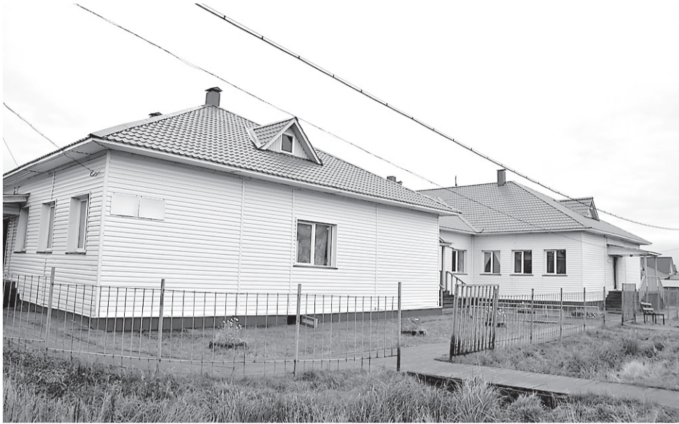
Ирина Муляк, фото автора и из личного архива героя публикации